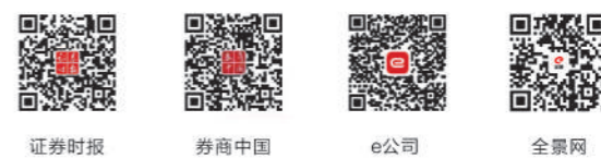
证券时报 券商中国 e公司 全景网