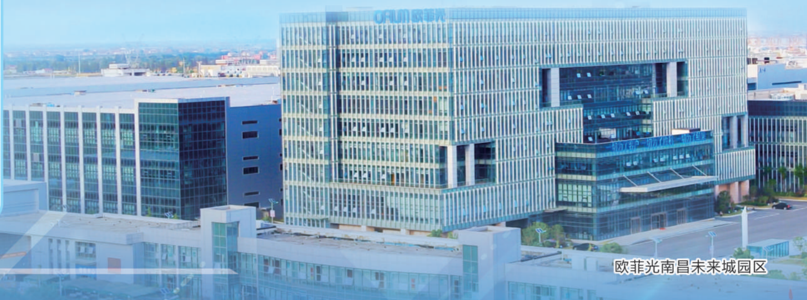
欧菲光南昌未来城园区

欧菲光主营业务产品包括光学影像模组、光学镜头、微电子及智能汽车相关产品等，广泛应用于以智能手机、智能家居等为代表的消费电子和智能汽车领域。欧菲光深耕于光学光电领域 20 余年，凭借深厚的技术积累，产品持续创新升级，通过产业链的平台化整合，在光学影像领域发展迅速，积累优质的客户资源，跻身于行业前列。