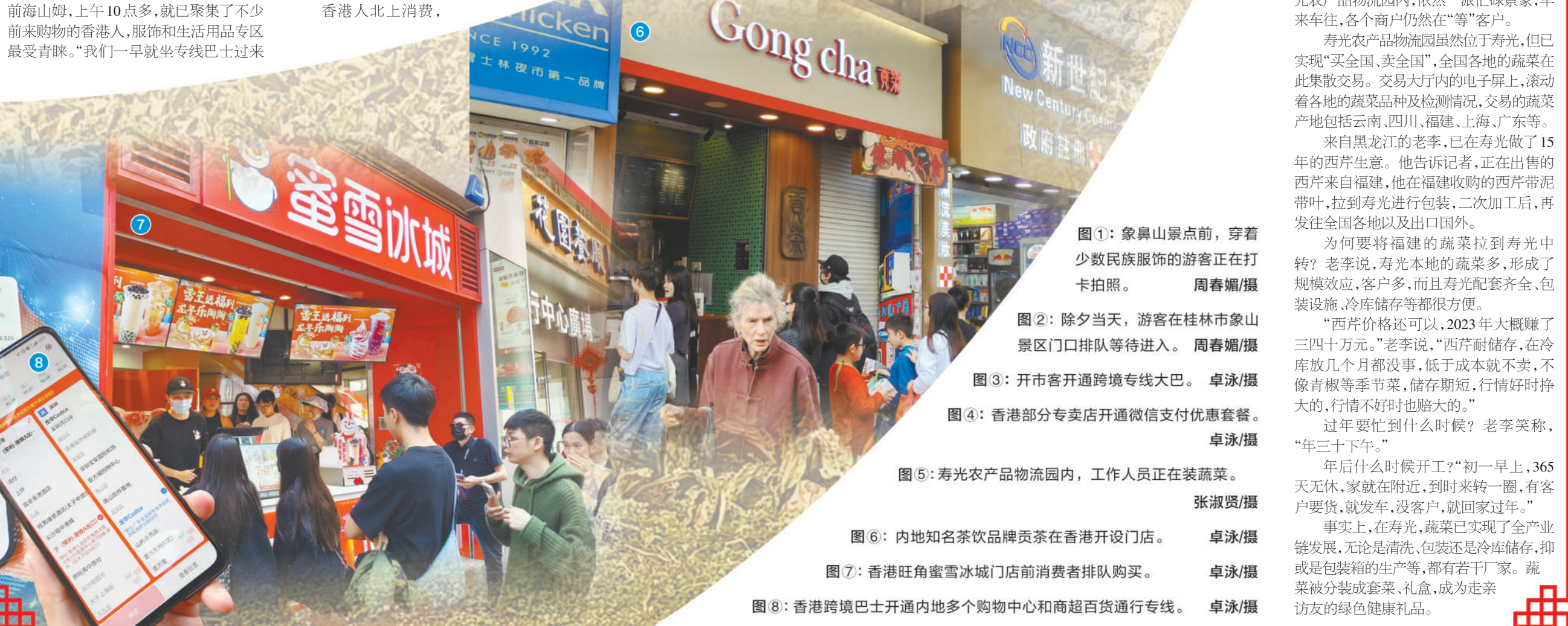
图1: 象鼻山景点前,穿着少数民族服饰的游客正在打卡拍照。