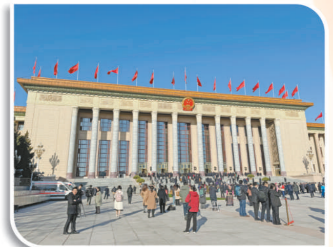
人民大会堂外,代表委员接受记者采访,打卡留念。