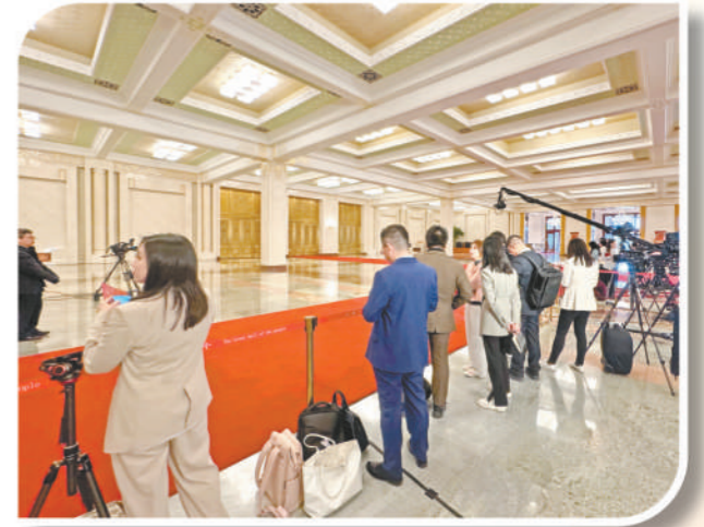
人民大会堂记者采访区。