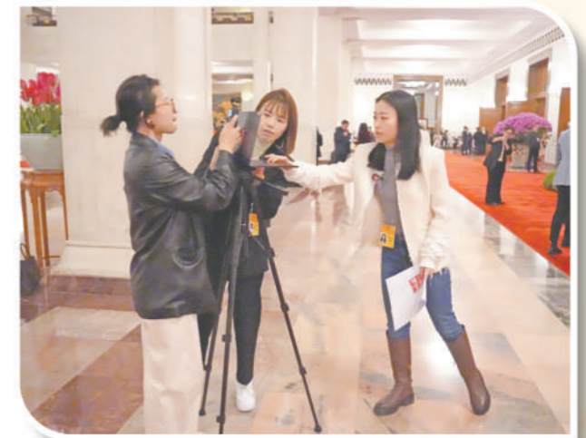
证券时报记者在人民大会堂准备拍摄现场视频。