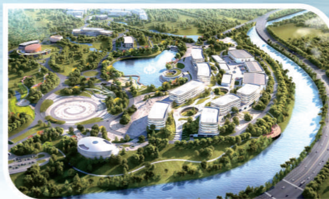
万华全球研发中心及总部基地效果图