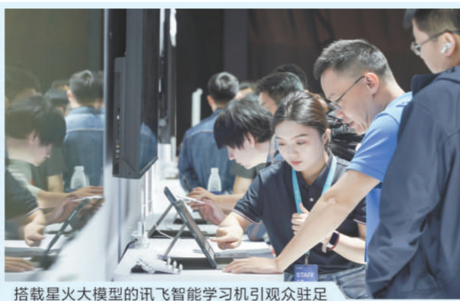
搭载星火大模型的讯飞智能学习机引观众驻足