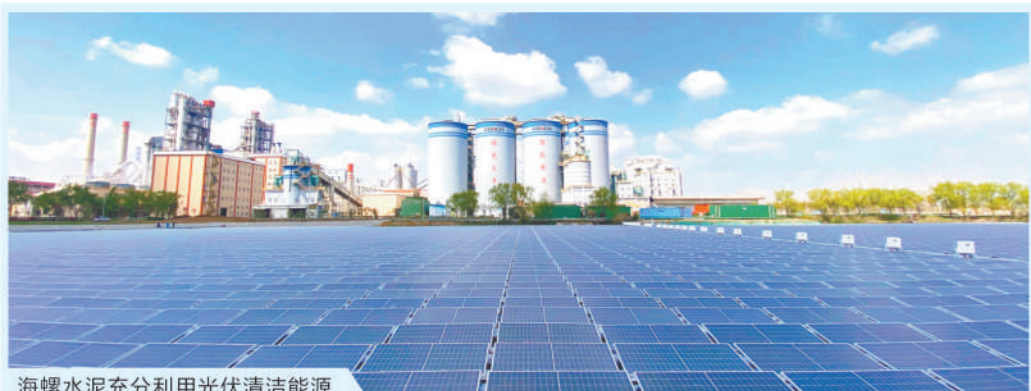
海螺水泥充分利用光伏清洁能源