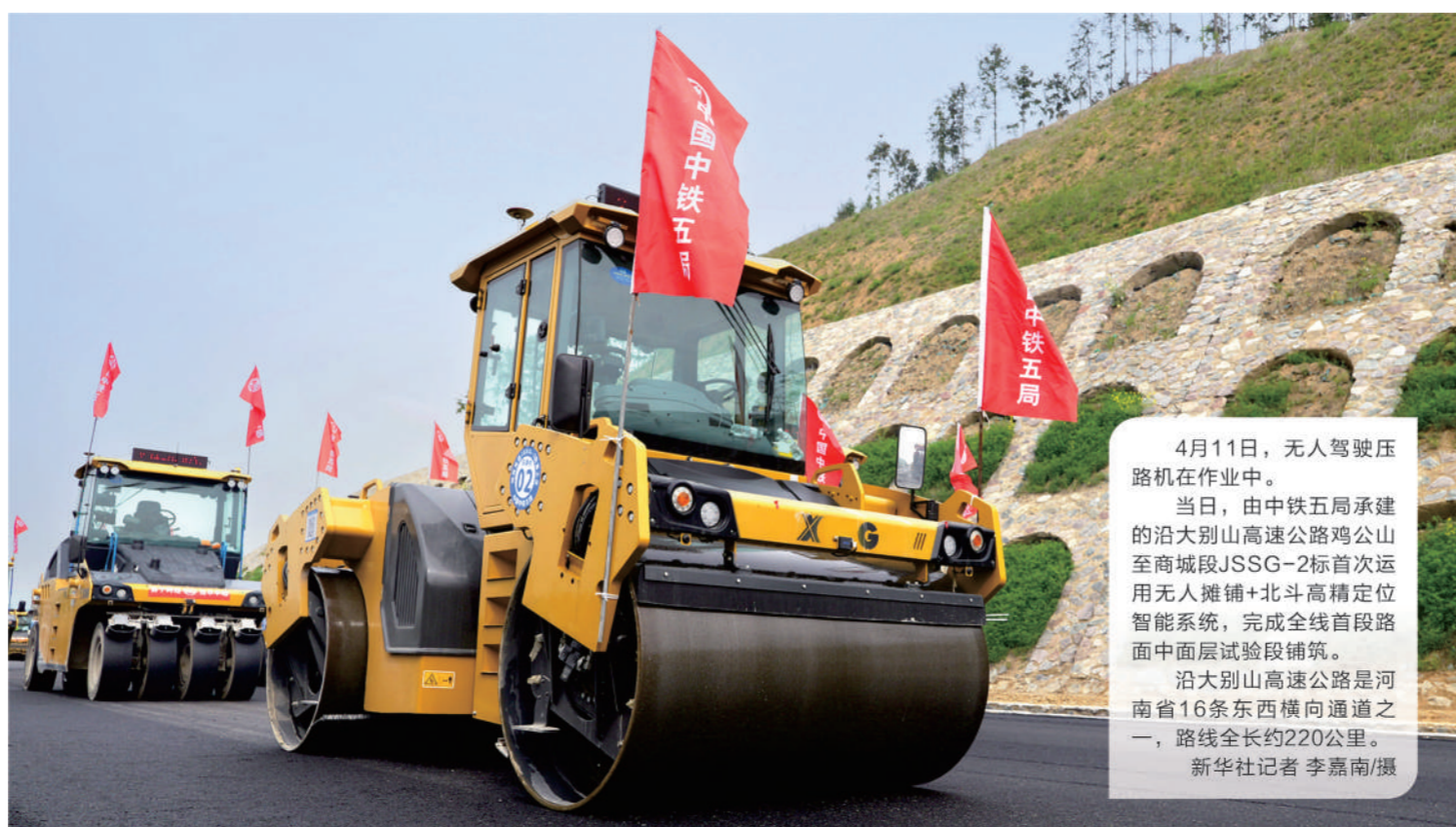
4月11日,无人驾驶压路机在作业中。当日,由中铁五局承建的沿大别山高速公路鸡公山至商城段JSSG-2标首次运用无人摊铺+北斗高精度定位智能系统,完成全线首段路面中面层试验段摊铺。沿大别山高速公路是河南省16条东西横向通道之一,路线全长约220公里。

据中国工程机械工业协会对挖掘机主要制造企业统计,3月国内销售各类挖掘机15188台,同比增长9.27%,实现增速由负转正。从更具实际意义的挖掘机开工小时数看,开源证券研报指出,3月前3周,国内流通