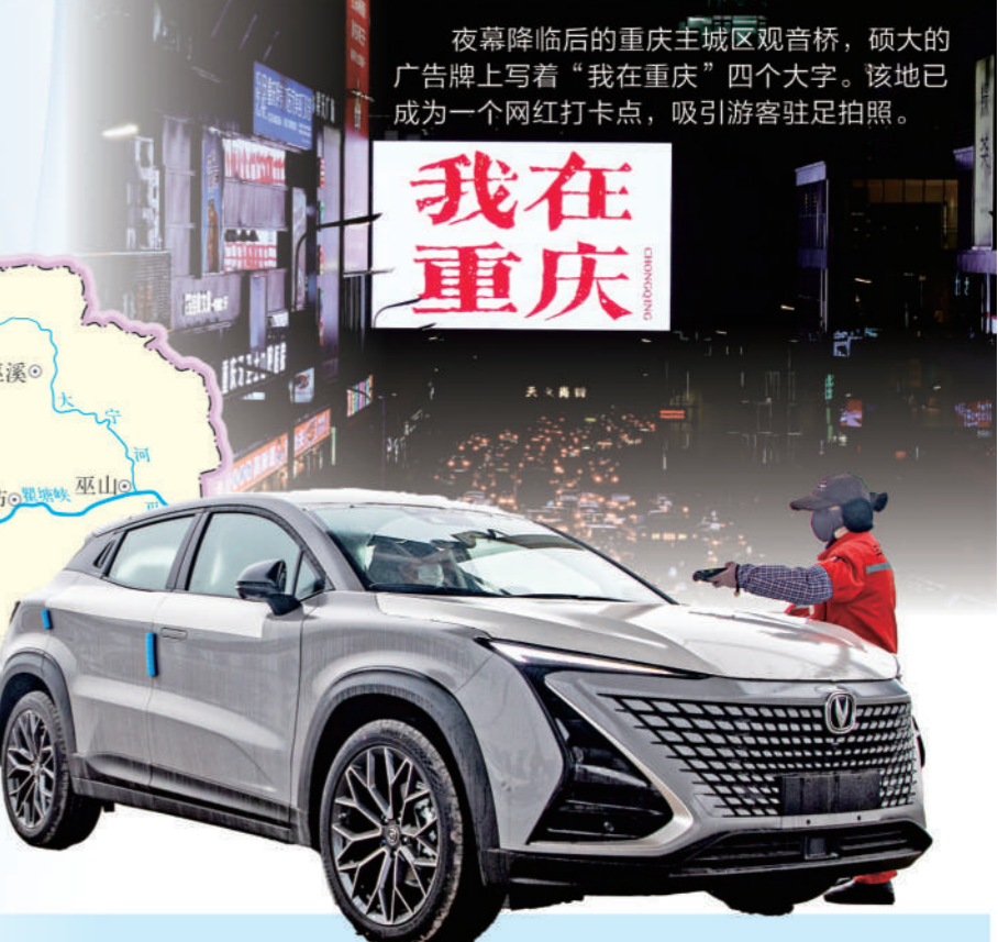
近日,在位于重庆市江北区的重庆鱼嘴站,出口商品车在等待装车。2023年重庆中欧班列整车进出口规模迎来突破,进出口整车数量双向均取得较大幅度增长,其中2023年重庆中欧班列整车出口超11万辆。

制造业标志性产业链发展全景图(2023年本),对智能网联新能源汽车、高端摩托车、功率半导体及集成电路等16条标志性产业链关键环节进行了梳理。