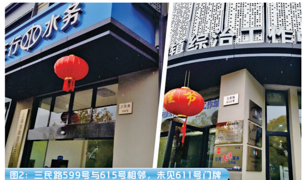
图2：三民路599号与615号相邻，未见611号门牌