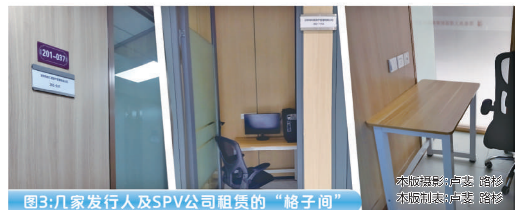
图3：几家发行人及SPV公司租赁的“格子间”