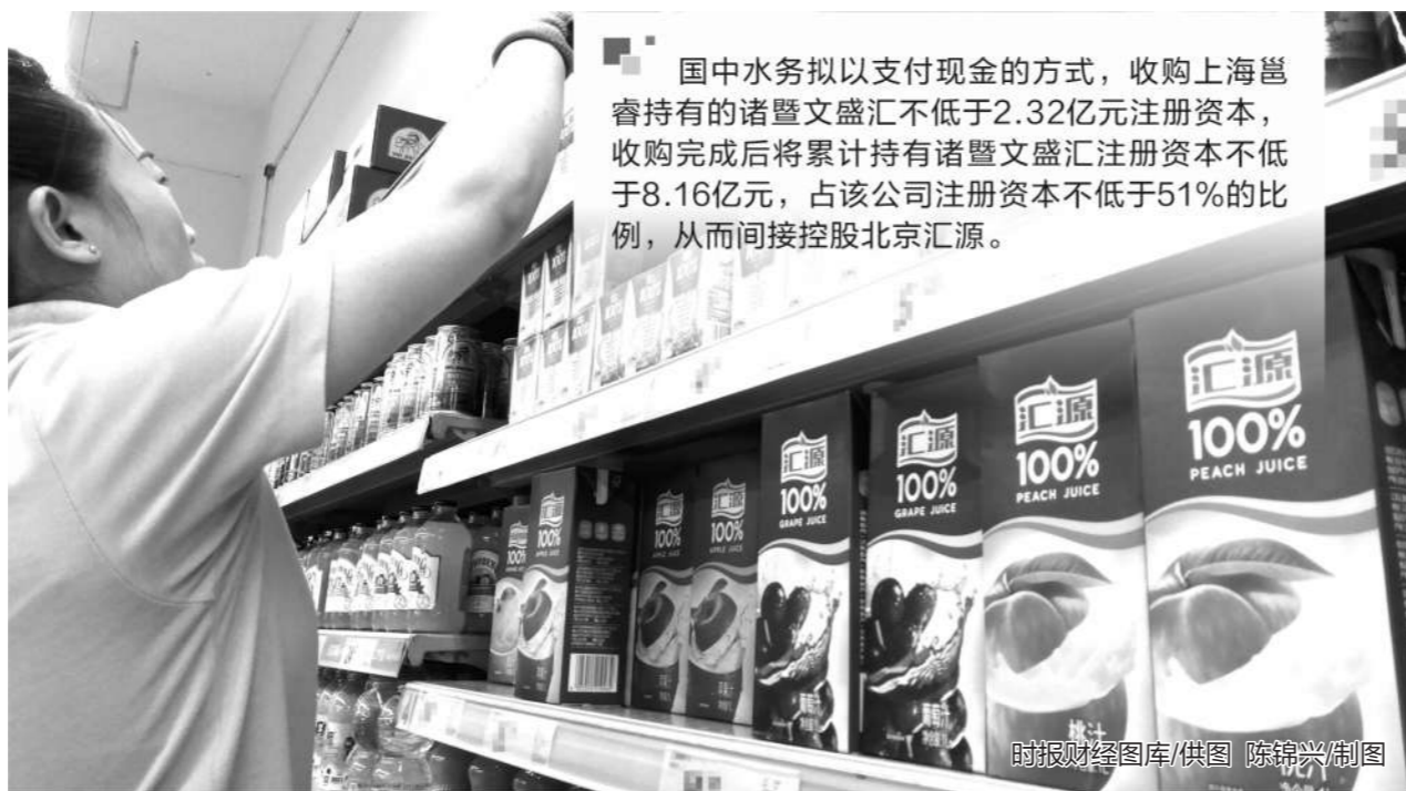
国中水务拟以支付现金的方式,收购上海崑崙持有的诸暨文盛汇不低于2.32亿元注册资本,收购完成后将累计持有诸暨文盛汇注册资本不低于8.16亿元,占该公司注册资本不低于51%的比例,从而间接控股北京汇源。

在该项目上实现投资收益8283.63万元,占当期归母净利润的275.77%,成为公司扭亏为盈的最大贡献者。