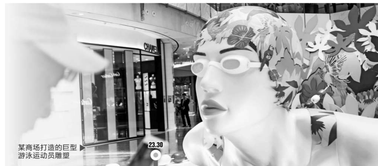
某商场打造的巨型游泳运动员雕塑

伊利股份此前表示,作为2024年奥运会中国体育代表团官方乳制品,公司陆续推出首款PET瓶装纯牛奶、伊利纯