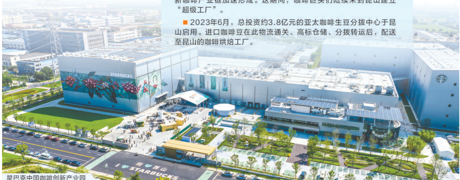
■ 从2020年开始, 昆山设立咖啡生豆贸易分拨中心。由此, 一条集咖啡生豆仓储分拨、烘焙研磨、平台交易、品牌销售于一体的全新咖啡产业链加速形成。这期间, 咖啡巨头们陆续来到昆山建立“超级工厂”。

星巴克原全球首席执行官纳思瀚在星巴克中国咖啡创新产业园开工时评价说:“这个园区是星巴克全球最好的工厂之一,从生豆到咖啡的垂直产业链规模化整合,这对星巴克全球来说也是第一次。我们看好昆山,看好昆山开发区,我们对中国市场抱有坚定不移的信心。”