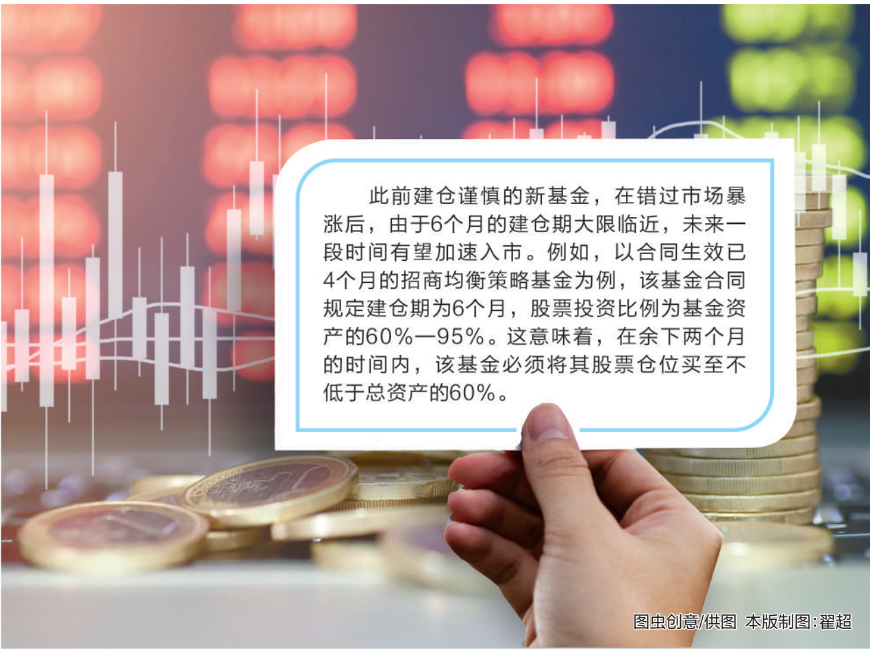
本版制图:翟超

年6月因业绩损失大，规模持续缩水被迫清盘。该港股主题基金规模大幅缩水的一个引致因素或许正是产品成立3个月时出现快速亏损，从而影响了此后基金经理的操作，并最终导致亏损进一步扩大。