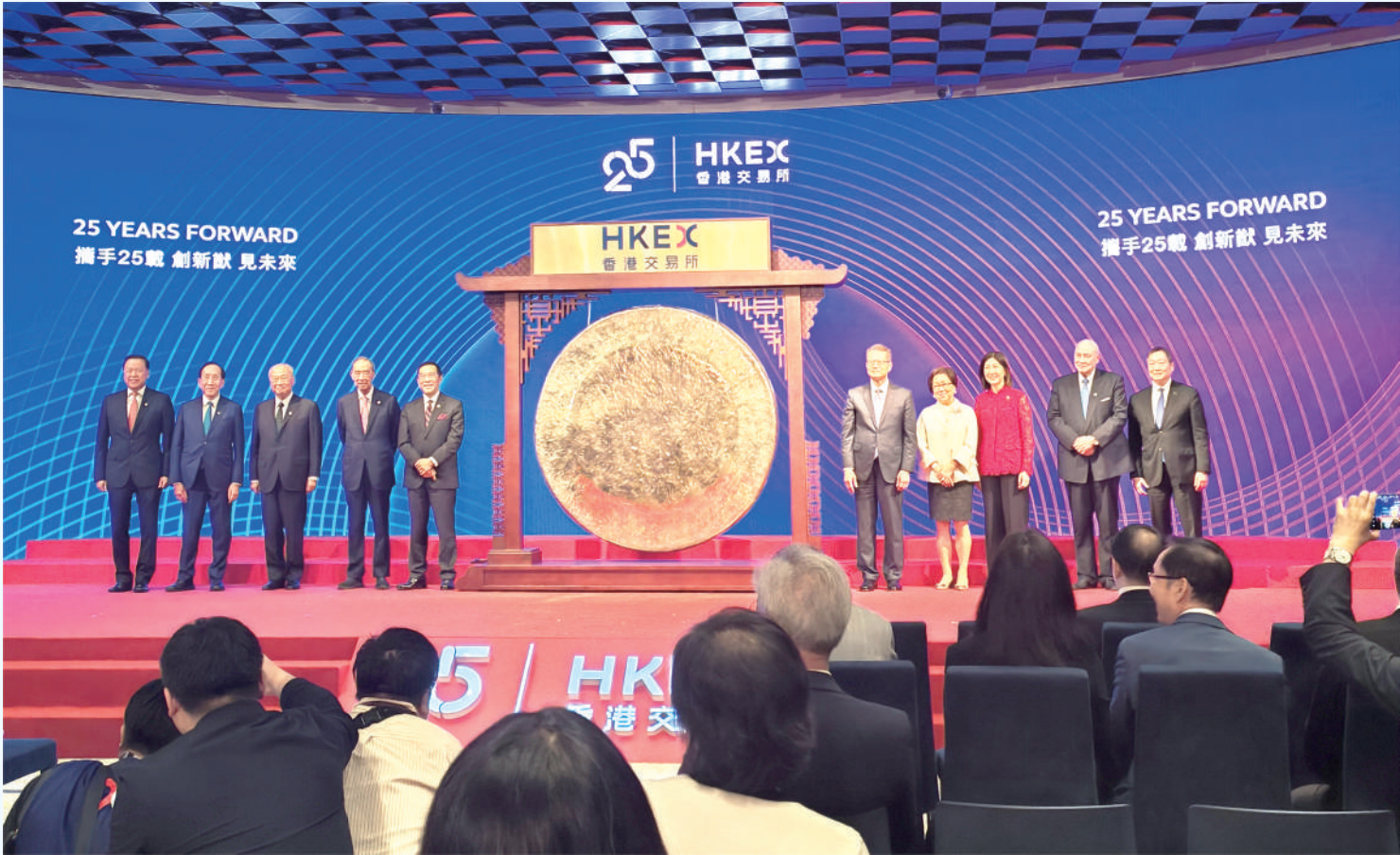
6月20日，香港交易所举办25周年庆祝活动。2000年3月6日，香港联合交易所(联交所)、香港期交所与香港结算合并于单一控股公司香港交易所旗下。香港交易所于当年6月27日以介绍方式在联交所上市，成为世界首批上市的证券交易所之一。(更多报道详见A4版)