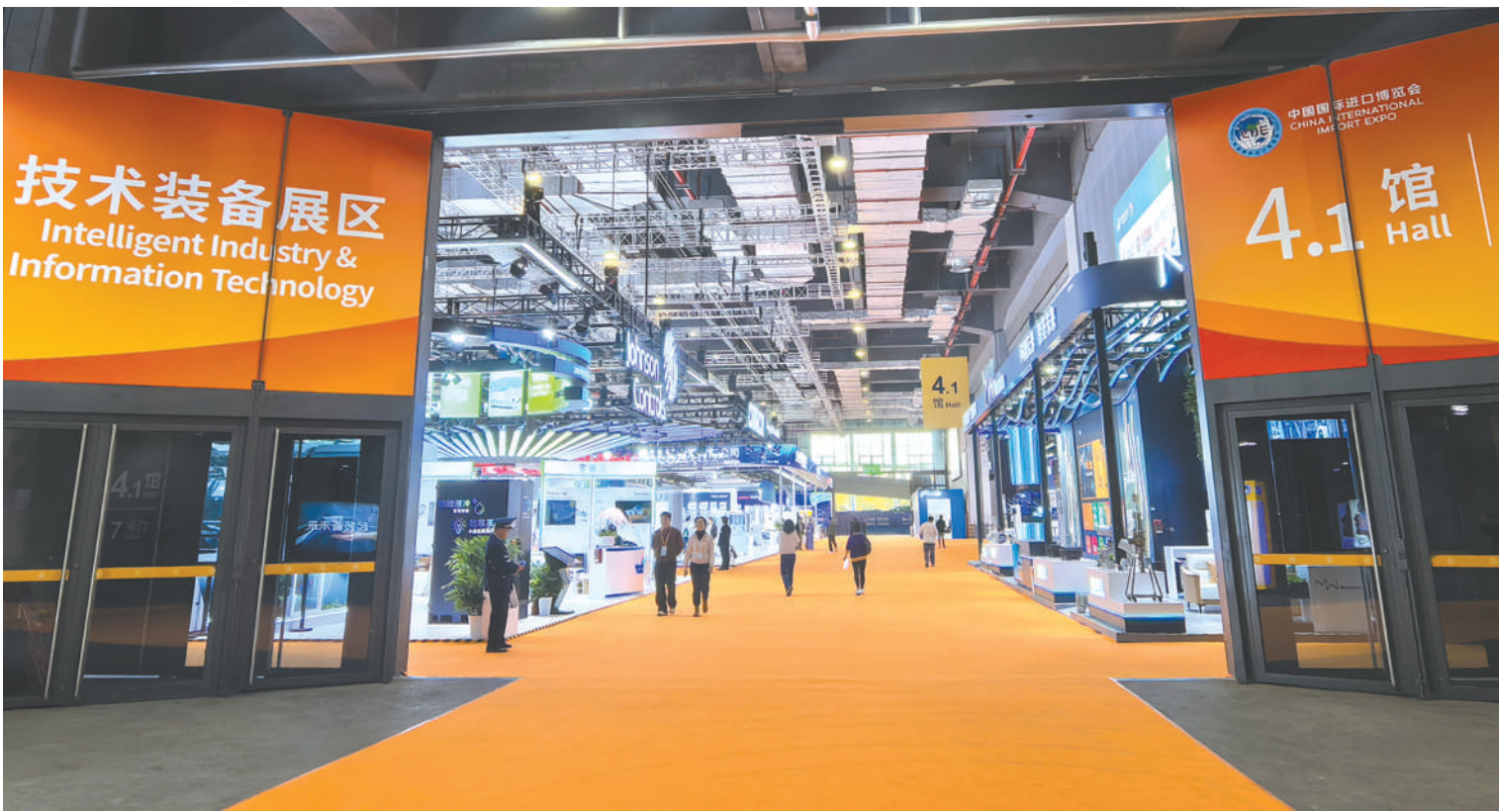
第八届进博会各大展区布展工作已全部完成,图为技术装备展区,展品已就位。