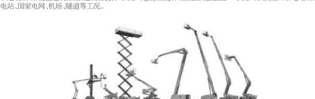
图:公司产品实景图

(二)公司生产经营模式 公司采用自主研发、生产、销售与服务相结合的生产经营模式。在生产制造方面,公司根据国内外客户采购的订单,制定生产计划,通过自主生产或委托生产的方式,完成产品的生产。在产品销售方面,公司通过直销和经销两种模式,向客户推广产品,直销模式主要应用于大型客户,经销模式主要应用于中小型客户。在售后服务方面,公司建立了完善的售后服务体系,为客户提供及时、专业的技术支持和维修服务。公司通过直销和经销两种模式,向客户推广产品,直销模式主要应用于大型客户,经销模式主要应用于中小型客户。在售后服务方面,公司建立了完善的售后服务体系,为客户提供及时、专业的技术支持和维修服务。