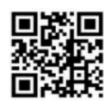
(互动交流问题征集专题页面二维码)

投资者的意见和建议。投资者可于2026年5月12日(周二)17:00前访问https://ir.p5w.net/gy,或扫描下方二维码,进入问题征集专题页面,提交您所关心的问题。公司将在活动上,对投资者所关心的问题进行认真且详实的回答。