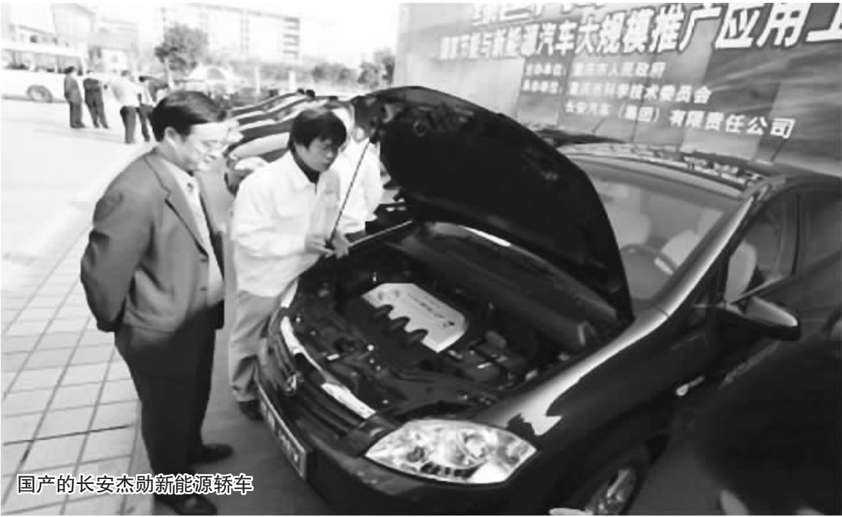
国产的长安杰勋新能源轿车

10亿元,高研发成本致使汽车定价无法与同级传统能源车媲美。由于新能源车处于推广阶段,给集团带来的利润也非常有限。他表示非常希望可以推出个人购车补助,并希望比亚迪可以参与制定相关的规则。