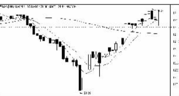
上证指数自 8 月 5 日反弹以来的一个月累计涨幅达 0.86%

陈亮分析说,自从公开市场操作利率企稳以来,市场的恐慌情绪逐渐消失,利率产品收益率随之止