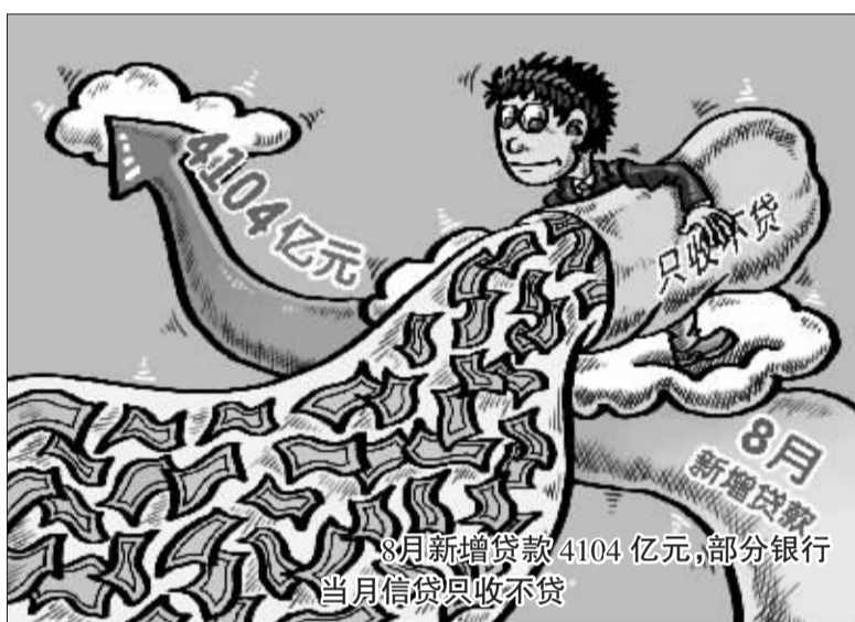
8月新增贷款4104亿元,部分银行当月信贷只收不贷

中长期贷款的大幅增加是导致8月份信贷超出预期的主要因素。央行数据显示,中长期贷款共增加5481亿元,其中企业中长期贷款增加3675亿元。相对于上半年中长期贷款在全部新增信贷中42.1%的占比,8月份贷款长期化的趋势更加