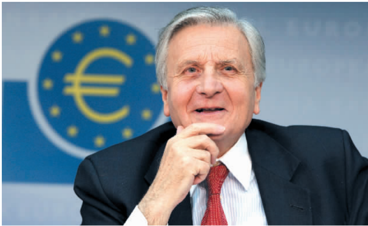
昨日欧洲央行决定把1年期和1个月期流动性操作延长至明年年初。

有分析人士表示,全球经济复苏步伐放缓,欧元区内部两极分化的现象也愈发明显,加上各国财政紧缩的压力,在2011年年底之前,欧洲央行都不大可能加息。与此同时,如果美联储继续采取宽松政策,欧洲央行恐怕也得跟进。