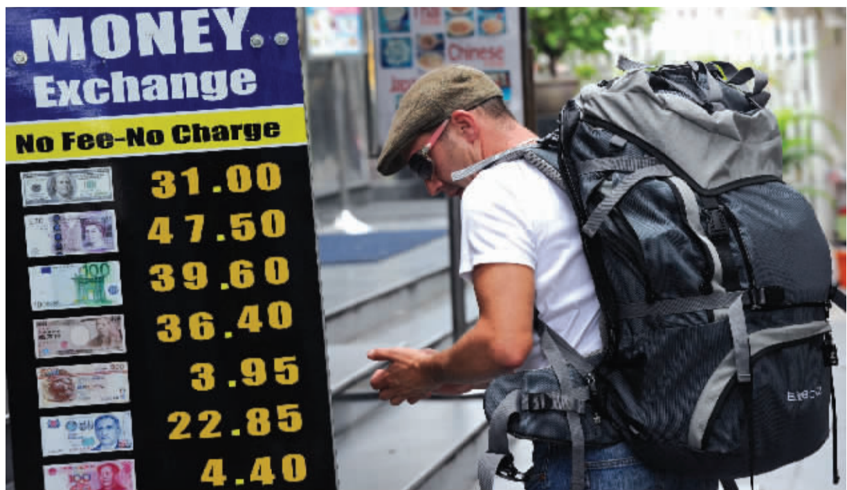
昨日泰铢兑美元汇率接近30的高位

热钱流入推升股市,但受多国着手阻击热钱的影响,昨日亚太地区股市普遍下跌,MSCI亚太指数下跌1.5%。跟随亚太股市的跌势,昨日欧洲股市早盘快速下挫,欧洲斯托克600指数跌幅超过1%,其中以矿业股跌幅最大。与此同时,欧元兑美元跌破1.3800大关。有消息指出,欧洲央行计划通过一项旨在迅速回笼流动性的资金招标,以抵消流动性大量增加的影响。