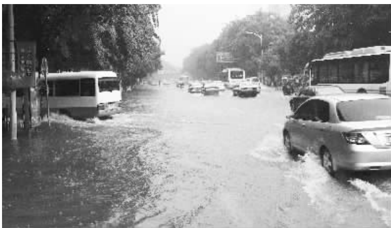
暴雨导致海口市多路段被淹

罗牛山(000735)多家下属单位受到不同程度的损失。其中,受灾较为严重的是公司各生猪养殖基地,海口景山学校和海南青牧实业有限公司等。罗牛山预计此次强降雨给公司造成的直接和间接损失共计约1000万元。海南海药(000566)文昌种植基地400亩牛耳枫、辣蓼遭到洪水浸泡,预计损失约500万元左右。同时,子公司海口市制药厂有限公司部分厂房及生产车间进水,致使公司部分净化系统损坏,预计损失约250万元左右。旅游业也是此次洪灾的重灾区。ST东海A(000613)尽管经营情况正常,但持续强降雨导致公司酒店入住率出现下降,经营收入约下降30%左右,其他没有较大损失。ST珠江