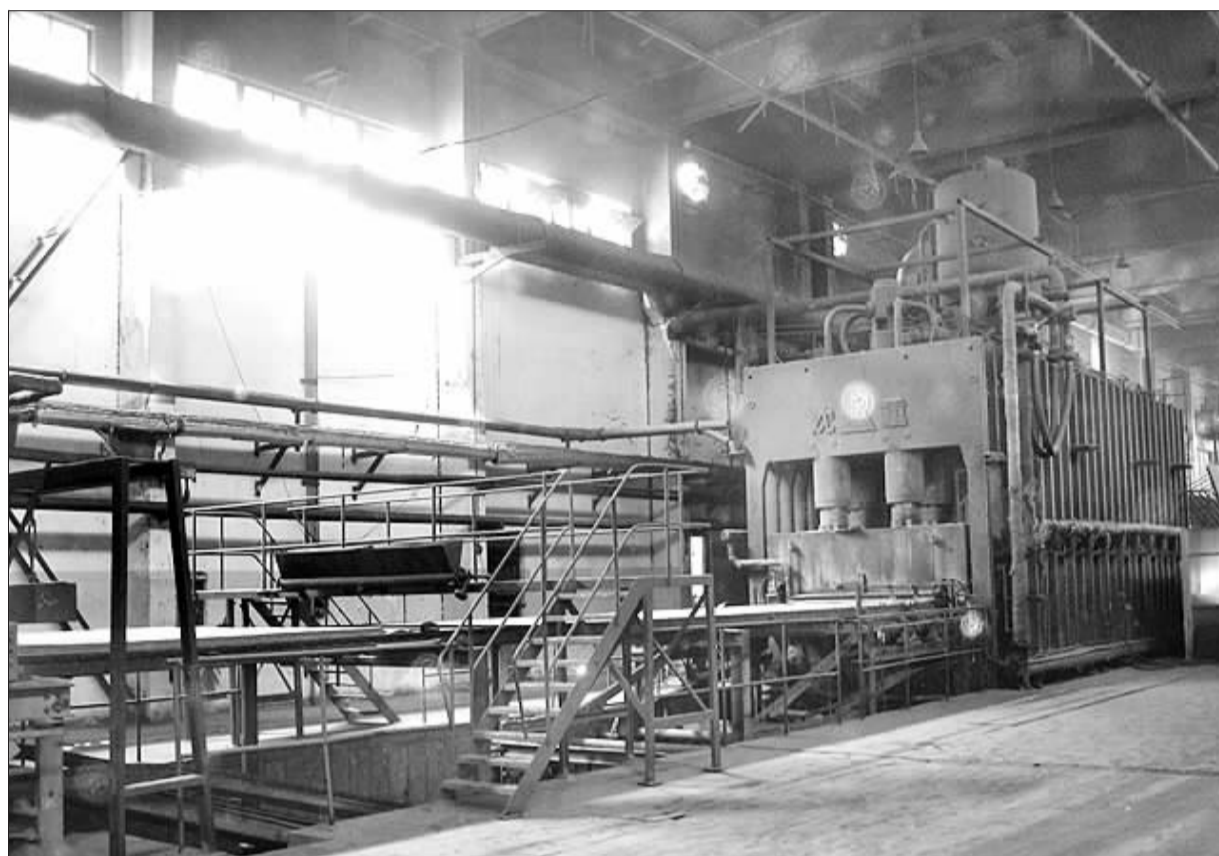
国栋建设拟出售设备

国栋建设试图将广元国栋闲置设备变现的举动表明,并非所有闲置设备都可以通过技改得以重新利用。有分析人士表示,国栋建设固定资产的