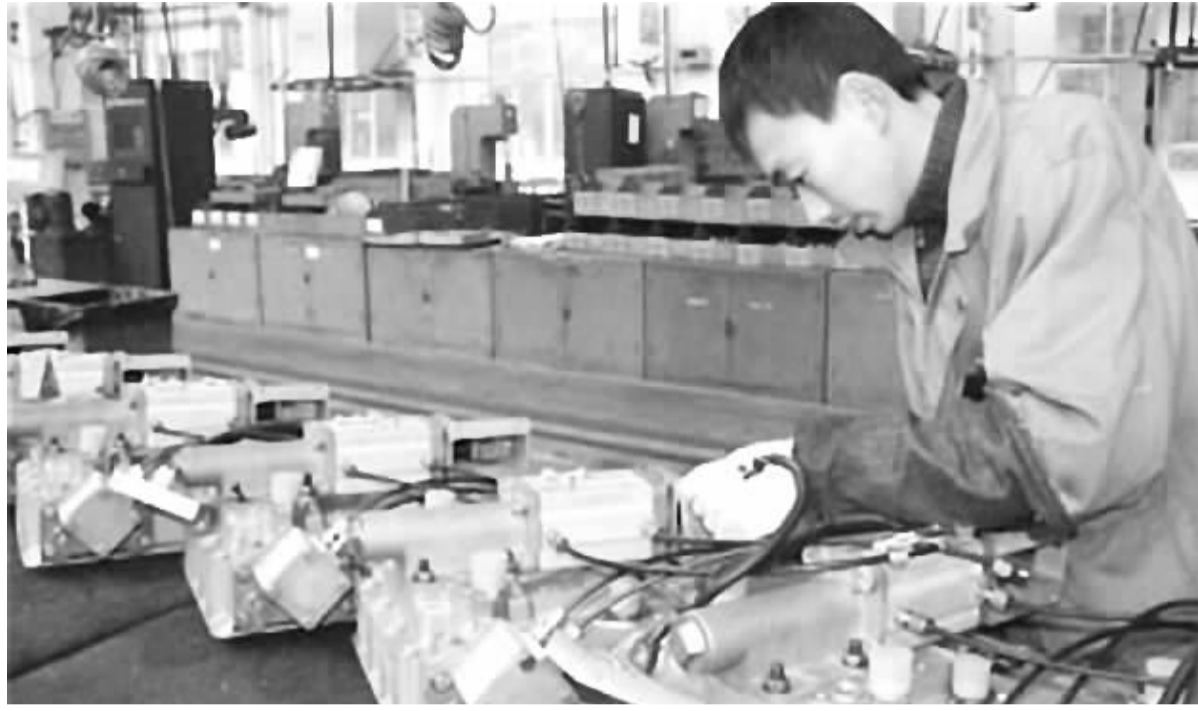
万里扬变速器生产车间

按照评估,山东临工的评估值为1.05亿元,评估值比账面价值增值1179.42万元,增值率12.66%。此次收购完成后,加上万里扬现有30万台和上市募集资金投资项目扩建的28万台产能,上市公司变速器年产能将超过100万台,成为国内变速器生产销售龙头,轻卡变速器市场占有率将位居全国第一。