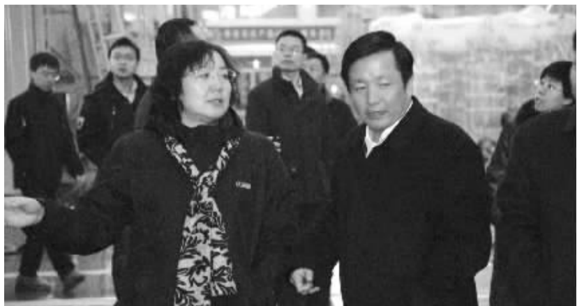
侯丽春(前左一)调研特变电工

20年来,新疆资本市场伴随着中国资本市场的发展而发展。证券时报记者专访新疆证监局局长侯丽春时,在感受到新疆资本市场20年发展成就的同时,也深刻体会到新疆独具的特色。