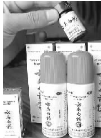
名医曲焕章创立于1902年的云南白药,为国人疗伤百余载,其配方也成为“国家机密”,享受严格的行政保护。

上述上市公司仅仅是云南资源的“冰山一角”,尚有大量资源类企业并未上市。云南资源丰富,价值巨大,并不逊于其他资源类省份。这些资源像珍宝一样埋藏在云南富饶的土地上,等待着人们前去发掘。(太平洋证券研究院)