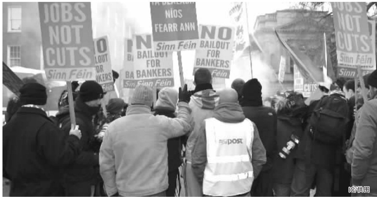
爱尔兰民众抗议政府救助银行

财政紧缩的举措让爱尔兰政府饱受抨击,爱尔兰反对党此前更批评政府接受金融援助是“卖国”行为。正当勒尼汉公布上述预算案时,抗议者纷纷聚集到爱尔兰议会外,不少抗议者将矛头直指本国的银行业,并要求政府对银行进行债务重组。有分析人士表示,接受援助会使爱尔兰丧失部分经济主权,这进一步加剧民众怨恨,债务危机或引发爱尔兰政局动荡。