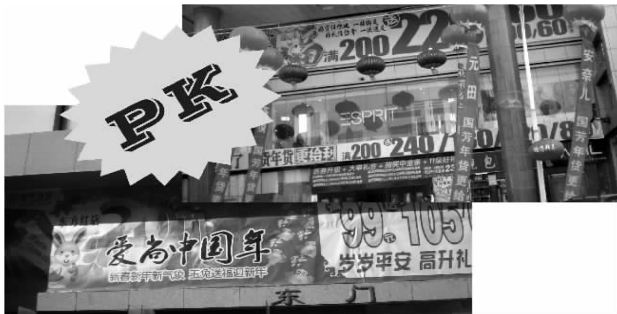
新华百货东方红店和对面国芳百货的促销广告针锋相对

宁夏国芳百货的信心并非凭空而来。记者调查得知,原银川新华商城6.5万平方米的经营场所,已经被甘肃国芳工贸(集团)股份有限公司以3亿元左右的价格买断。“贺春喜满堂,采购在国芳,满200元送240/180……”,春节前后,隔着一路玉皇阁南街,宁夏国芳百货前大幅的促销口号,和对面新华百货东方红店“爱尚中国年,满100元送105/65……”的