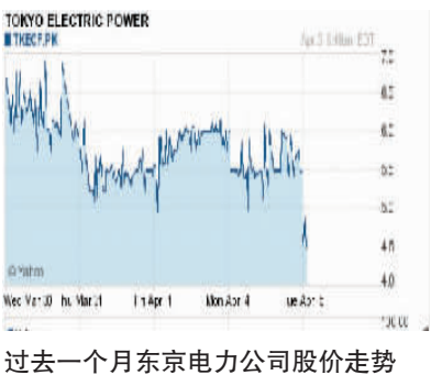
过去一个月东京电力公司股价走势