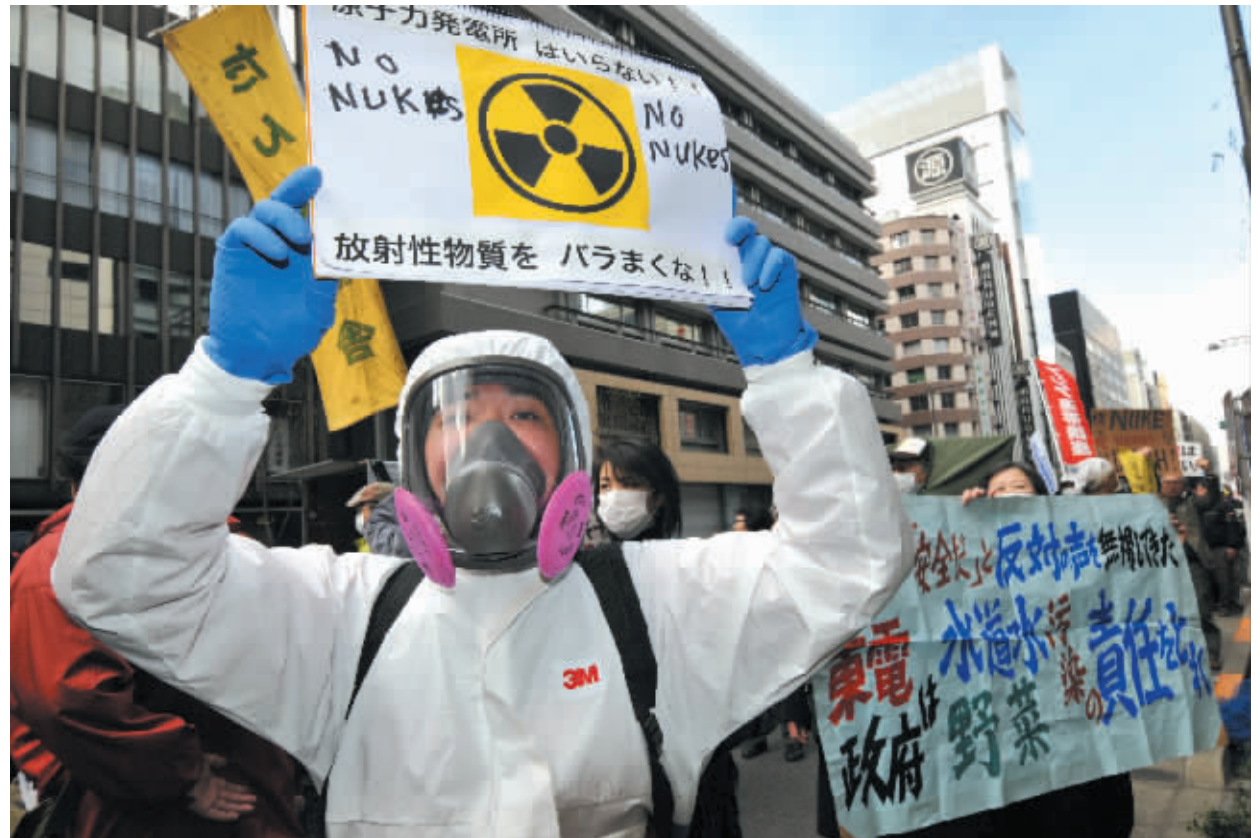
日本民众在东京电力公司总部门口抗议核泄漏