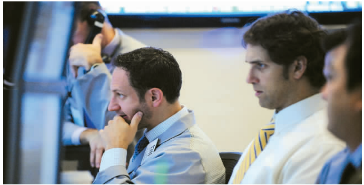
纽交所交易员紧张关注各大公司的一季度财报。

油价持续上涨不仅给企业盈利带来挑战, 更给全球经济复苏带来重大影响。国际能源署 (IEA) 昨日表示, 由于中东北非动荡局势以及由此引发的石油供应中断局面可能还将持续数月, 今年全球石油市场会进一步趋紧。但 IEA 同时称, 有初步迹象显示, 当前过高的油价