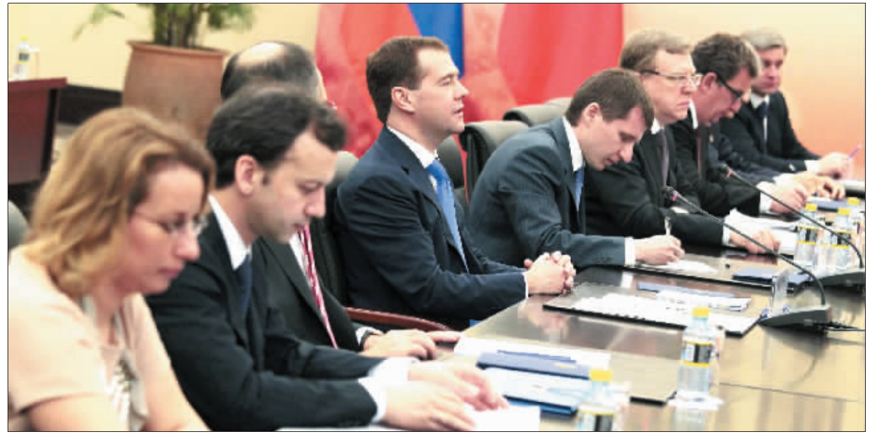
俄总统梅德韦杰夫(右五)抵达三亚,出席与国家主席胡锦涛的会谈。

IMF在日前公布的2011年春季《世界经济展望》报告中指出,全球经济继续保持稳定复苏之势,但油价上涨以及新兴经济体通胀走高对全球复苏形成新的威胁。世界银行行长佐利克表示,食品价格剧烈波动给全球的贫困人口带来巨大