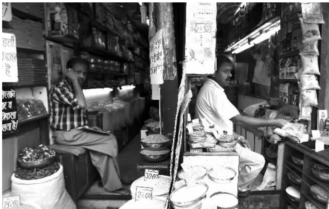
新兴经济体中印度物价上升压力最为明显,IMF预计其今年通胀率将达到7.5%

根据金砖国家领导人第三次会晤后发表的《三亚宣言》指出,粮食、能源等大宗商品价格高位波动成为当前世界经济复苏面临的新风险,国际社会要相应加强对大宗商品金融衍生品市场监管,防止出现扰乱市场的行为。不过,据美国新兴市场投资基金研究公司(EPRF)公布的数据显示,新兴市场股票型基金正重新吸引资金流入。分析人士认为,新兴经济体为控制通胀而采取的措施无可厚非,投资者相信一些新兴经济体的通胀压力将受到控制。