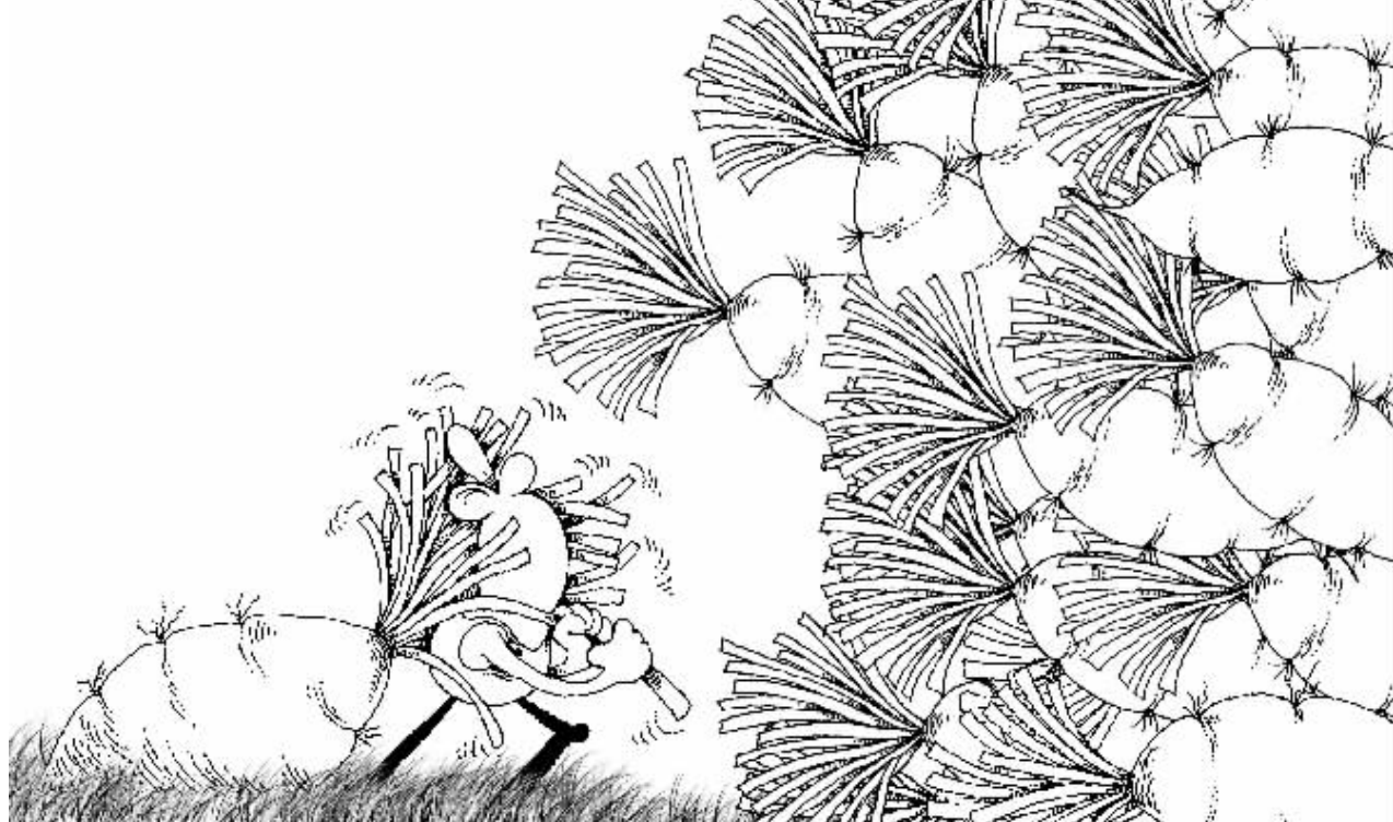
拔萝卜——挖掘有价值的公司