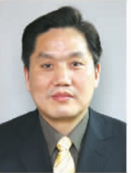
上海申银万国证券首席经济学家 杨成长