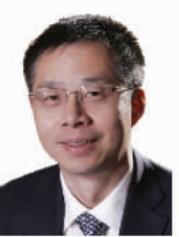
国泰君安证券总经济师、首席经济学家 李迅雷