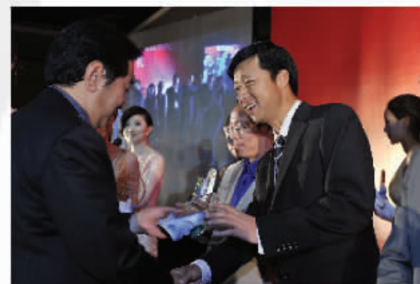
“2010年度早期项目投资最佳创投机构”获得者颁奖现场。