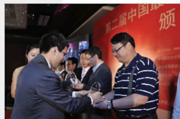
“2010年度创业投资社会贡献奖”获得者颁奖现场。