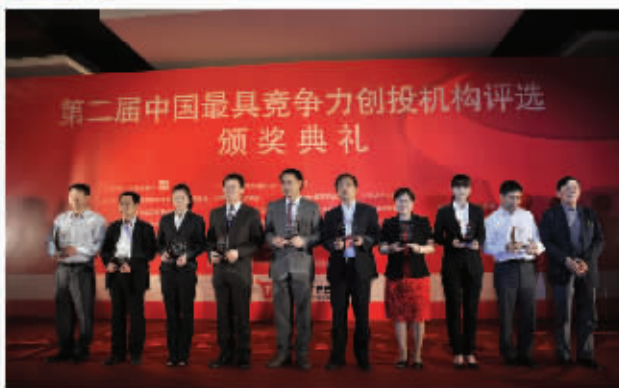
“2010年度最佳投资案例”获得者合影。