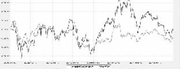
注:1.本基金业绩比较基准为沪深300指数收益率*55%+上证国债指数收益率*45%