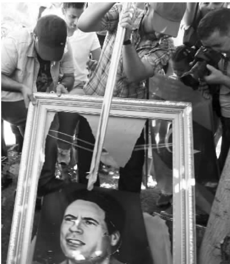
昨日利比亚驻土耳其大使馆前爆发反卡扎菲抗议

作为欧佩克(OPEC)成员之一,利比亚是世界第十七大、非洲第三大石油出口国。利比亚爆发战争前,日产石油160万桶,占世界石油产量的2%。受利比亚年初停