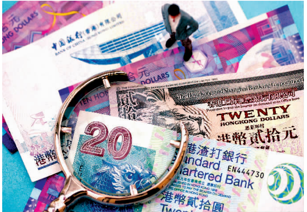
随着通胀持续高企，港币持续贬值，近段时间以来，香港各界对联系汇率制度的质疑之声不绝于耳，联汇制度成为当前港人热议的一个焦点话题。

维基解密还引述文件指出，汇丰银行内部认为，随着香港作为中国金融中介人的角色重要性愈来愈高，联汇制度将会被检讨。维基解密披露的文件指出，香港为了维持本身稳定及运作良好的金融中心地位，即使是脱离联系汇率制度，也需要最少花费几年时间去讨论，而在这段时间，如何抵消投机力量的影响将会是香港金管局面临的重大难题。