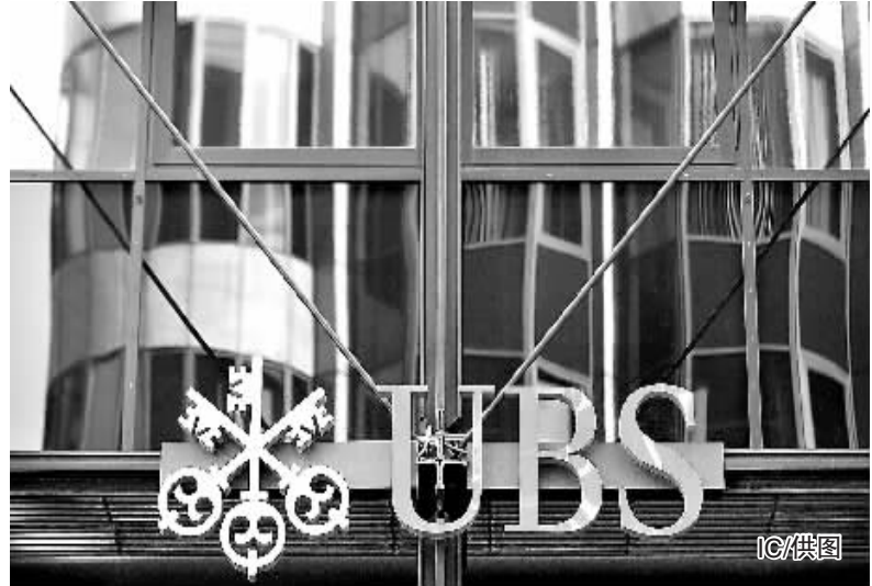
10%。今年以来,瑞银股价已累计下跌35%。有分析人士表示,此次事件或与瑞士央行日前突然干

受此影响,在昨日欧洲股市早盘交易中,瑞银股价暴跌近10%。今年以来,瑞银股价已累计下跌35%。有分析人士表示,此次事件或与瑞士央行日前突然干