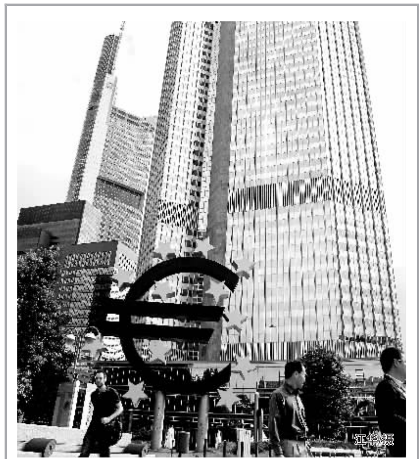
多国央行携手提供美元流动性

投资大师索罗斯表示,欧元区债务危机是2008年金融危机落下的后遗症。世界银行行长佐利克也表示,全球经济已经进入危险期,欧洲必须要承担起共同货币的责任。