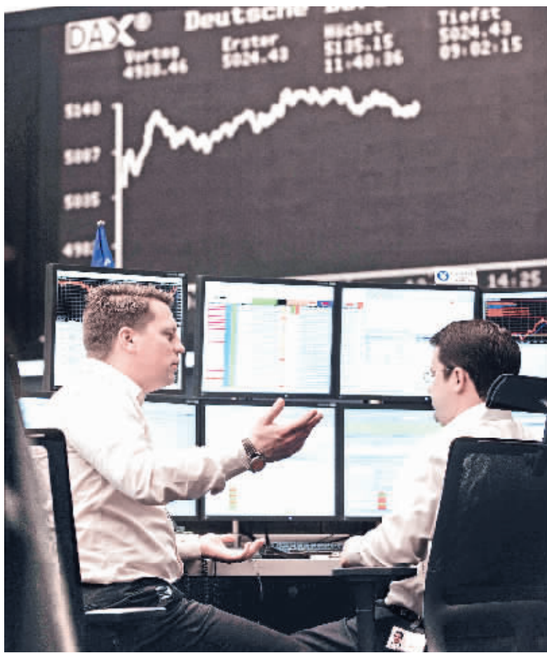
德国DAX指数昨日盘中涨幅逾4%

据海外媒体报道,欧元区官员正在讨论应对希腊债务危机的新方案,包括运用杠杆操作扩大4400亿欧元欧洲金融稳定基金的规模,并且在希腊发生债务违约的情况下,避免欧洲银行体系受到严重影响以及