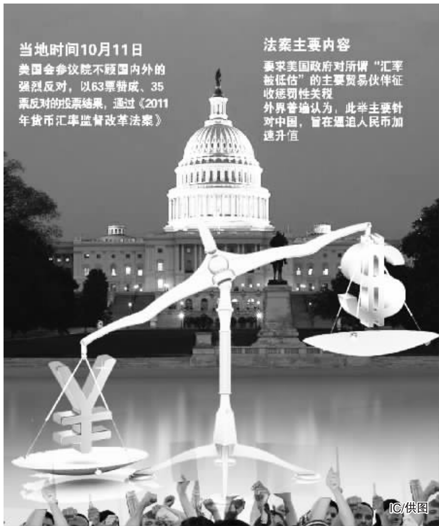
当地时间10月11日 美国参议院不顾国内外的强烈反对,以63票赞成、35票反对的投票结果,通过《2011年货币汇率监督改革法案》 法案主要内容 要求美国政府对所谓“汇率被低估”的主要贸易伙伴征收惩罚性关税 外界普遍认为,此举主要针对中国,旨在逼迫人民币加速升值