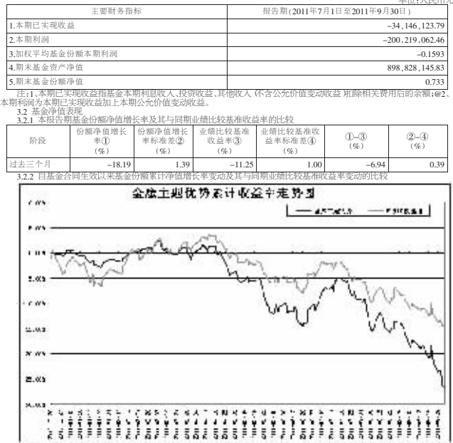
图1:截至报告期末,本基金的各项资产比例符合基金合同约定的各项比例,即本基金投资于股票、债券的比例不低于基金资产总值的80%,符合中国证监会规定的比例。