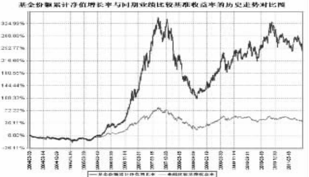
注:2004年3月30日本基金成立,按照银河银泰理财分红证券投资基金合同规定,本基金自基金合同生效日起...