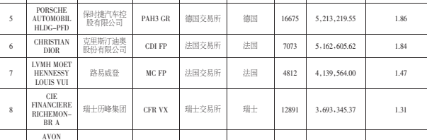
注:截止日期为2011年9月30日。 1.本基金自2011年7月13日成立,自合同生效日起至本报告期末不是一个完整会计年度,自合同生效日起至本报告期末不是一个完整会计年度。

53 主要财务指标和基金净值表现 单位:人民币元 1.本期已实现收益 -2,519,758.22 2.本期利润 -18,327,109.77 3.加权平均基金份额本期利润 -0.0616 4.期末基金资产净值 280,902,974.38