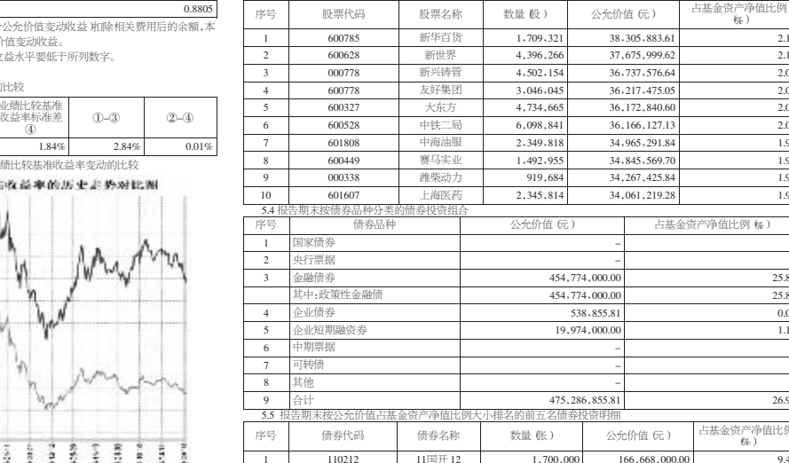
注:①本基金合同约定本基金投资组合为:股票资产占基金资产的比例不低于基金资产净值的80%...

§3 主要财务指标和基金净值表现 单位:人民币元 主要财务指标 1.本期已实现收益 -55,620,565.78 2.本期利润 -234,700,752.06