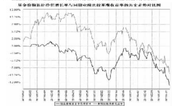
注:①本基金合同约定本基金投资组合为:股票资产占基金资产的比例范围为60-95%;债券资产占基金资产的比例范围为0-35%...

§4 基金管理人承诺 本基金经理人及董事保证本报告所载资料不存在虚假记载、误导性陈述或重大遗漏,并对其内容的真实性、准确性和完整性承担个别及连带责任。