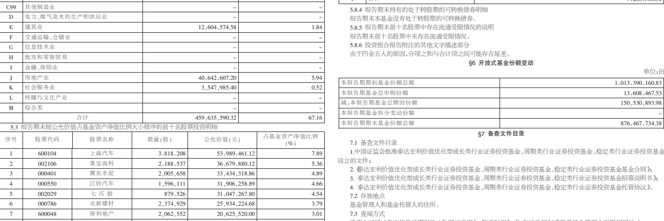
注:本基金于2011年10月1日至2011年12月31日。