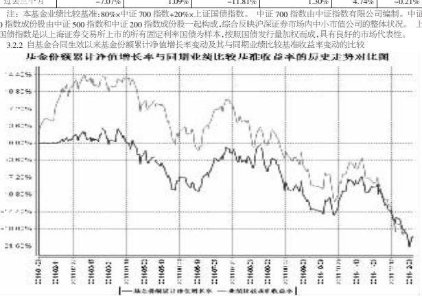
注:本基金于2011年1月26日成立,在建仓期间及本报告期末本基金的投资比例已达到基金合同约定的各项投资比例。