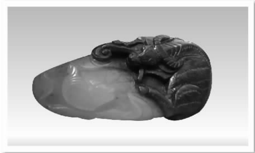
“风之于野”1500元忐忑买进的玉壶（上图）；玉店老板补偿“青蛙公主的外甥”的“黑牛白鱼”（下图）。

说实话，看了这些玉友第一块玉的故事，感觉已经超越两眼一抹黑的“初体验”者的平均水平——大多数情况下，新手买到物有所值的玉件已经相当于中奖了。我也想起了自己的第一块玉，不过究竟哪块是第一说不清楚，因为是在网上买的，并且一次买了好几件。后来逐渐懂玉