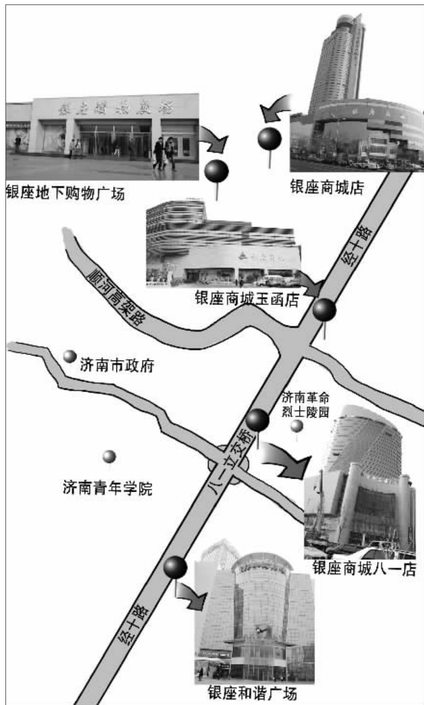
吴比较/制图

作?鲁商集团并没有给出清晰的交代,比如济南项目是银座股份在运作,但是北京、哈尔滨等项目却没有公告。