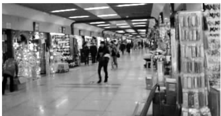
往年人气最旺的义乌国际商贸城一区今年也显得极为冷清。

2011年义乌小商品城成交额首破500亿元,并连续21年位居全国专业市场榜首。虽然今年国际形势很复杂,但小商品贸易具有很强的生命力,存在着刚性需要。若想实现新的增长,不是不可能,但要付出更大的努力。”吕少丽说。(李小平)