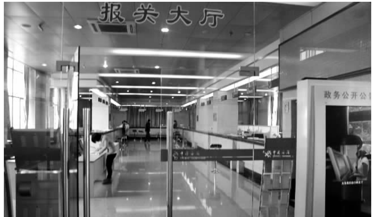
由于出货物减少,与往年同期相比,义乌海关报关大厅工作人员今年的工作轻松了很多。